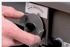
Paso 1 Ajuste de guías al diámetro apropiado.