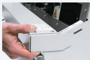
Paso 3 Ajuste de la mesa delantera.