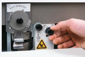
Paso 2 Ajuste del ángulo de corte y cabezas de curva.