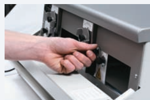
Paso 5 Ajuste del deslizador derecho.